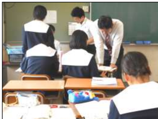
中間テスト前、アンサータイムで質問中

次の期末テストの時には、部活動の大会が間近ですが、計画的に学習にも力を入れて、どちらも全力で取り組んでいけるとよいと思います。