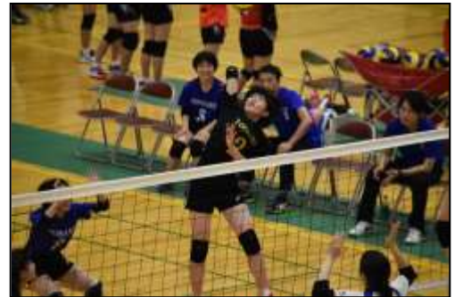
写真:バレーボール部春の愛日大会の様子