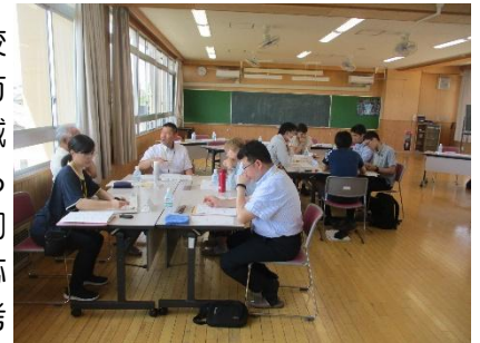
学校運営協議会の様子

6月1日(月)に、令和8年度の第1回の学校運営協議会が行われました。校長から学校運営の基本的方針について説明があり、その方針について委員の方から承認をしていただきました。その後、「地域学校協働本部を活かして、地域防災をどのように進めていくとよいか」について話し合いました。委員からは、「避難したときに、互いに知っている協力できる関係をつくるのが大切でないか」「避難の仕方についてマニュアルを作り、それを基に臨機応変に対応することが必要ではないか」などの意見が出されました。これらの意見を参考にして、今後の活動を進めていきます。