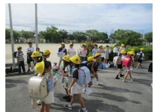
あいさつ運動の様子

6月22日(月)から7月3日(金)の朝の登校時に、児童会役員と委員長が、掲揚塔付近に並んで「あいさつロード」をつくり、「顔を見て」や「笑顔で」などのミッションカードを持ちながら、あいさつ運動を行っています。最初は、とても恥ずかしがりながらあいさつをしていた子どもたちが、次第に大きな声であいさつできるようになってきました。ミッションカードの「顔を見て」や「笑顔で」を意識しながらあいさつをする子どもたちが増えました。