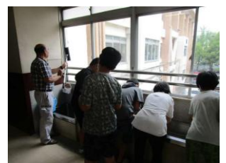
環境サポ隊の活動の様子

6月25日(木)の6限の委員会時に、環境サポ隊の活動が行われました。今回は、園芸委員会の子どもたちと一緒に花の苗植えと花壇の整備を予定していましたが、あいにくの雨のため、校内の窓拭き活動を行いました。子どもたちの手の届かない所をサポーターさんが拭き、手の届く範囲を子どもたちが拭くなど、協力して作業をすすめ、普段子どもたちだけでは行えない場所まできれいにすることができ、とても助かりました。